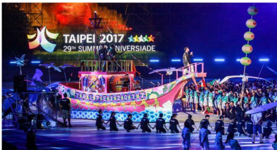
圖 2

隨著人工智能持續演進，行之有年的 STEAM（科學、技術、工程及數學），跨界融入美感藝術(Art)，進化為 STEAM，推動教育不應過度強調單一領域知識的傳遞，應加入藝術元素，創造更具美感在地的生活品質。2017 年於臺北舉辦世大運，運用科技技術結合在地藝術，不僅點亮臺灣在地的特色文化，也創造感動讓世界看見臺灣(如圖 3)，讓這座美麗的福爾摩沙享譽於世界。