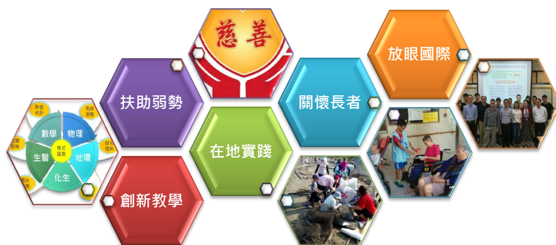
圖 4 吾善盡社會責任及在地關懷實踐行動照片(筆者提供)

近年來，在困窘的教育環境中，吾凝聚共識，翻轉教學，更新課程地圖，落實創新教學，一起建構資源共享的優質教學場域；在高齡少子化處艱難時期，吾參與地方社區長者關懷，一起扶助弱勢提升社會流動。在生活環境每況愈下，吾實踐社會責任，運用在地社群連結，一起參與減塑及種樹等愛護地球活動；在國際外交瓶頸上，吾把感動傳遞給世界各地的人，一起讓臺灣熱情的種子散播於全球(如圖 4)。